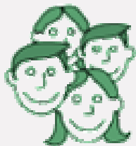
Aumento de la motivación de los empleados