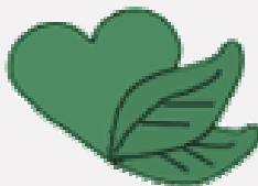
Mejora de la imagen