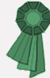
Ventajas de competitividad