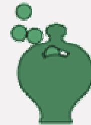
Ahorro de costes